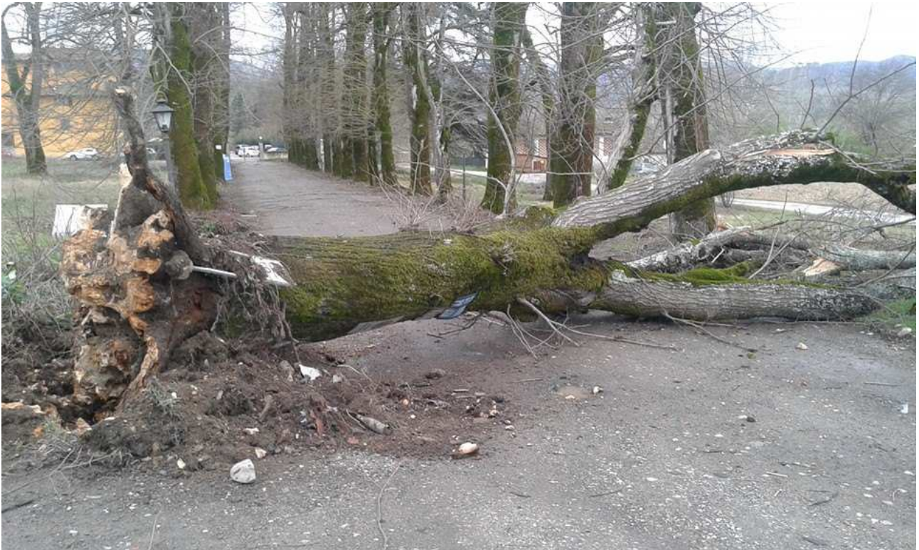
Borgo San Lorenzo