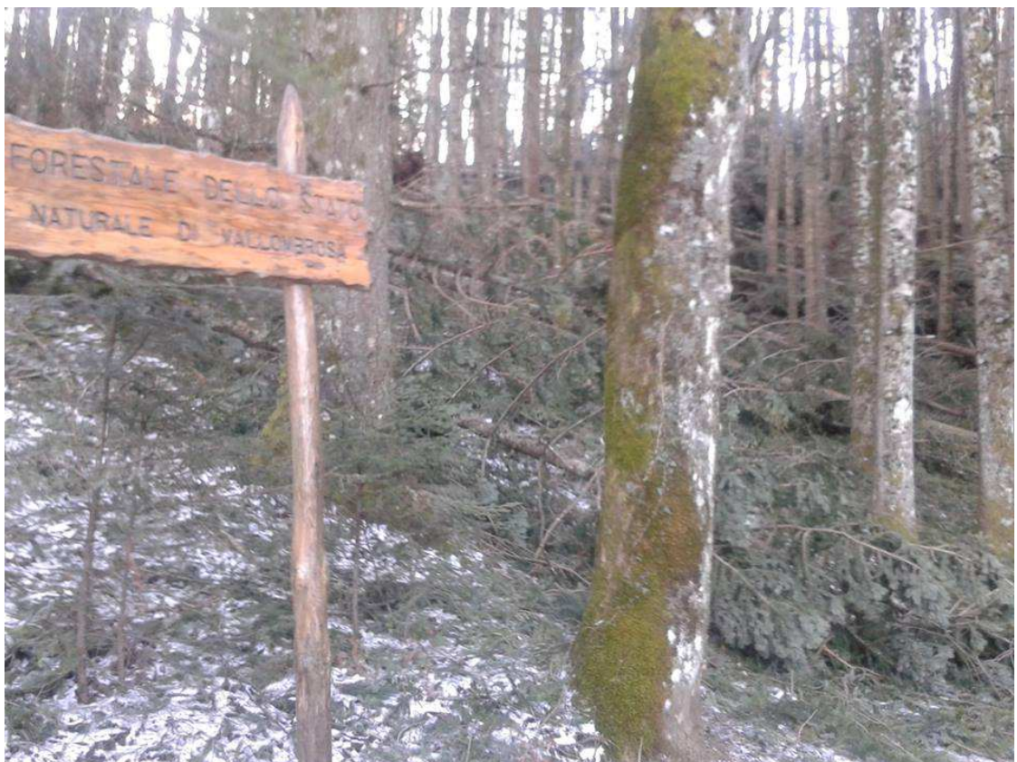
Foresta Vallombrosa (Reggello)