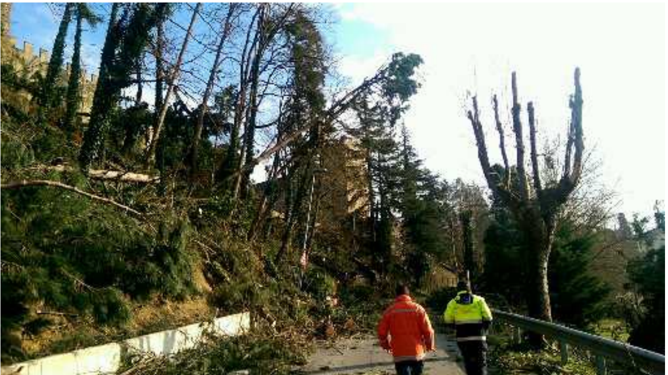
via Lippi - Scarperia e San Piero