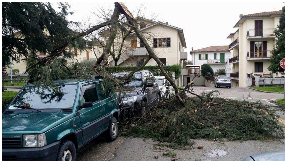
Borgo San Lorenzo