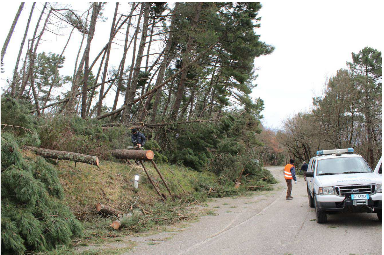
SR 65 della Futa