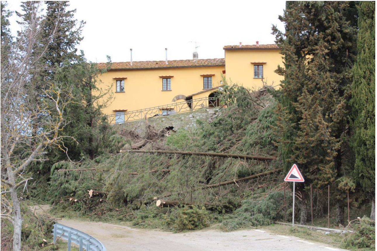
SR 65 della Futa