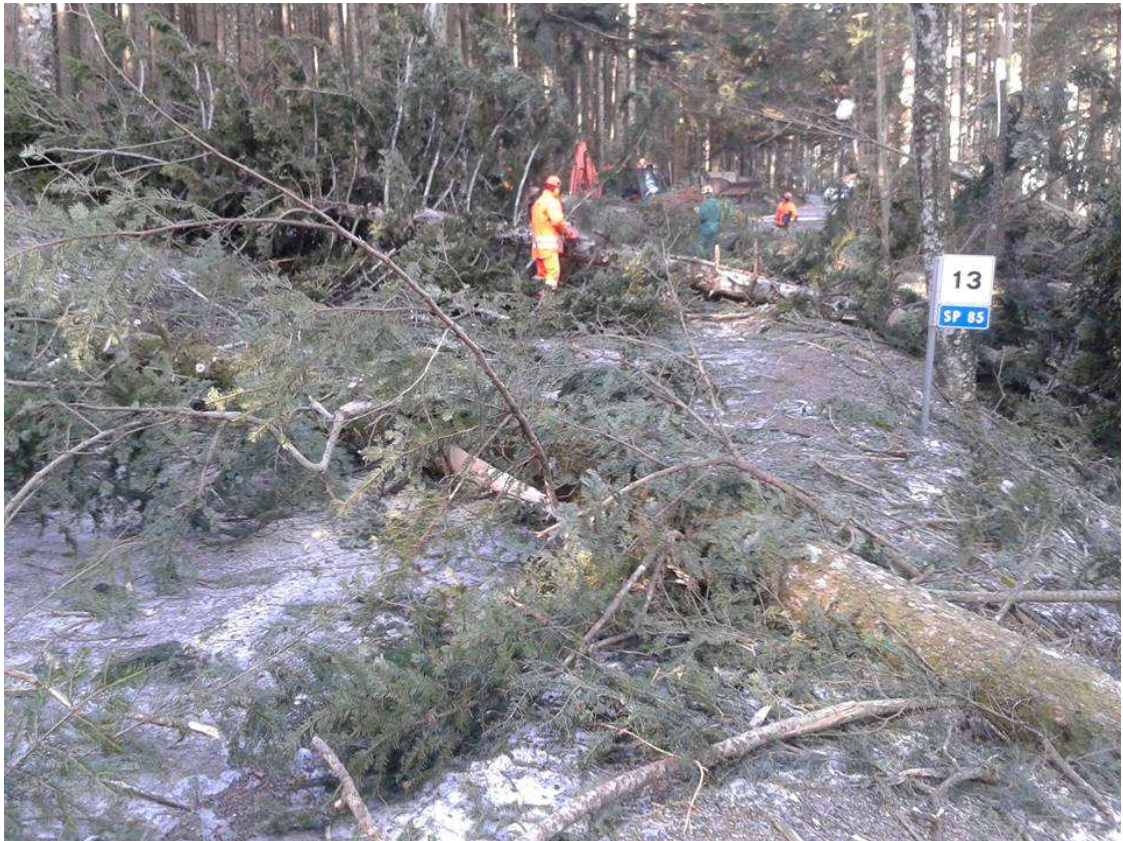
SP85 di Vallombrosa (Reggello)