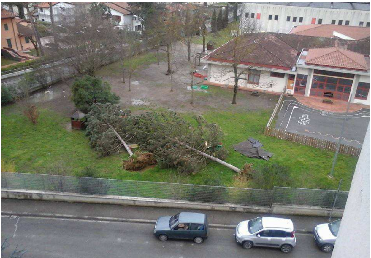
Scarperia e San Piero