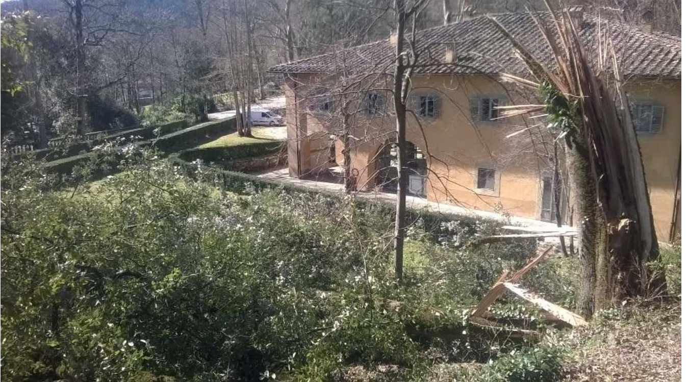
Parco di Villa Demidoff (Vaglia)