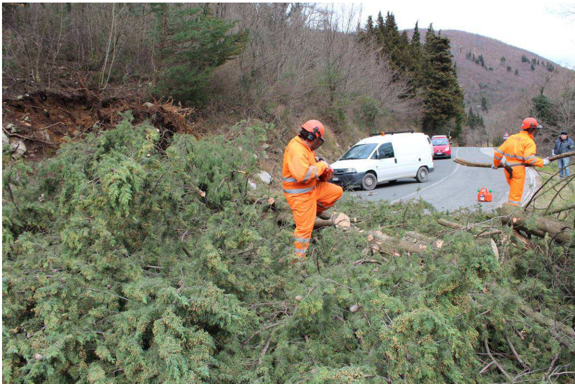
SP 107 di Legri (Calenzano)