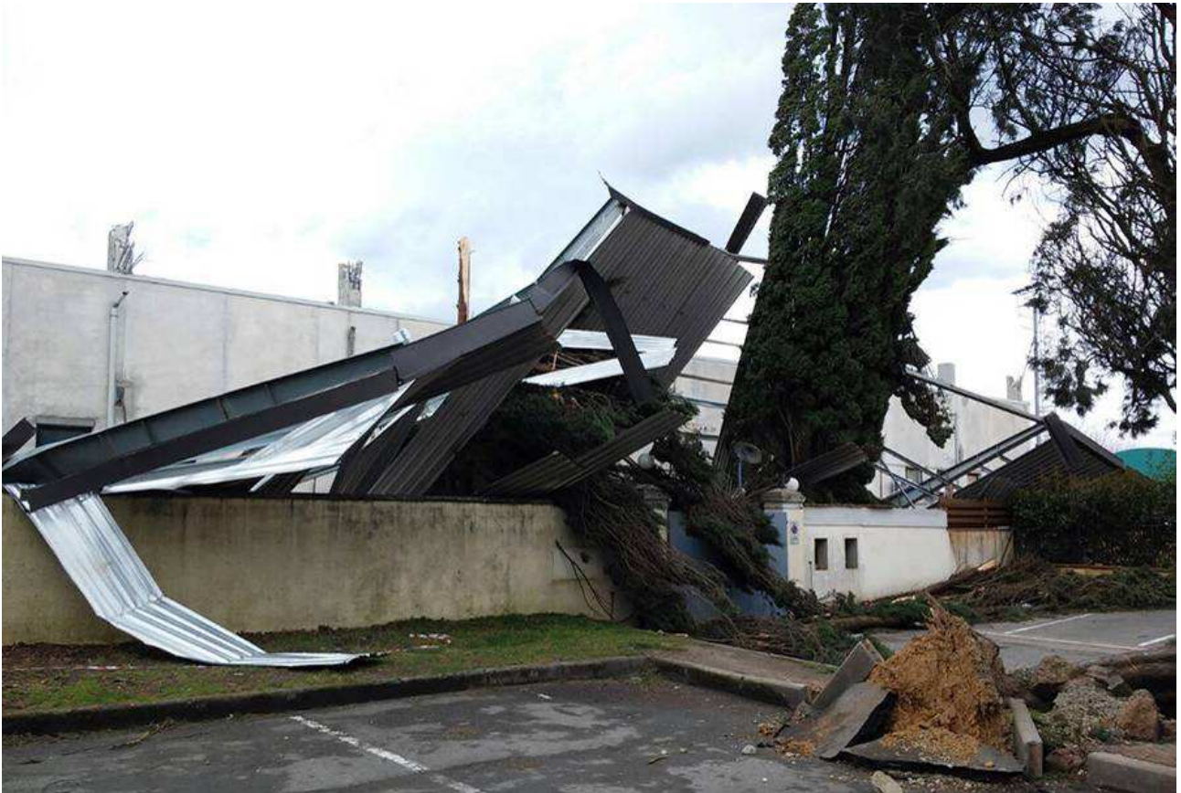
Impianto Sportivo - Scarperia e San Piero