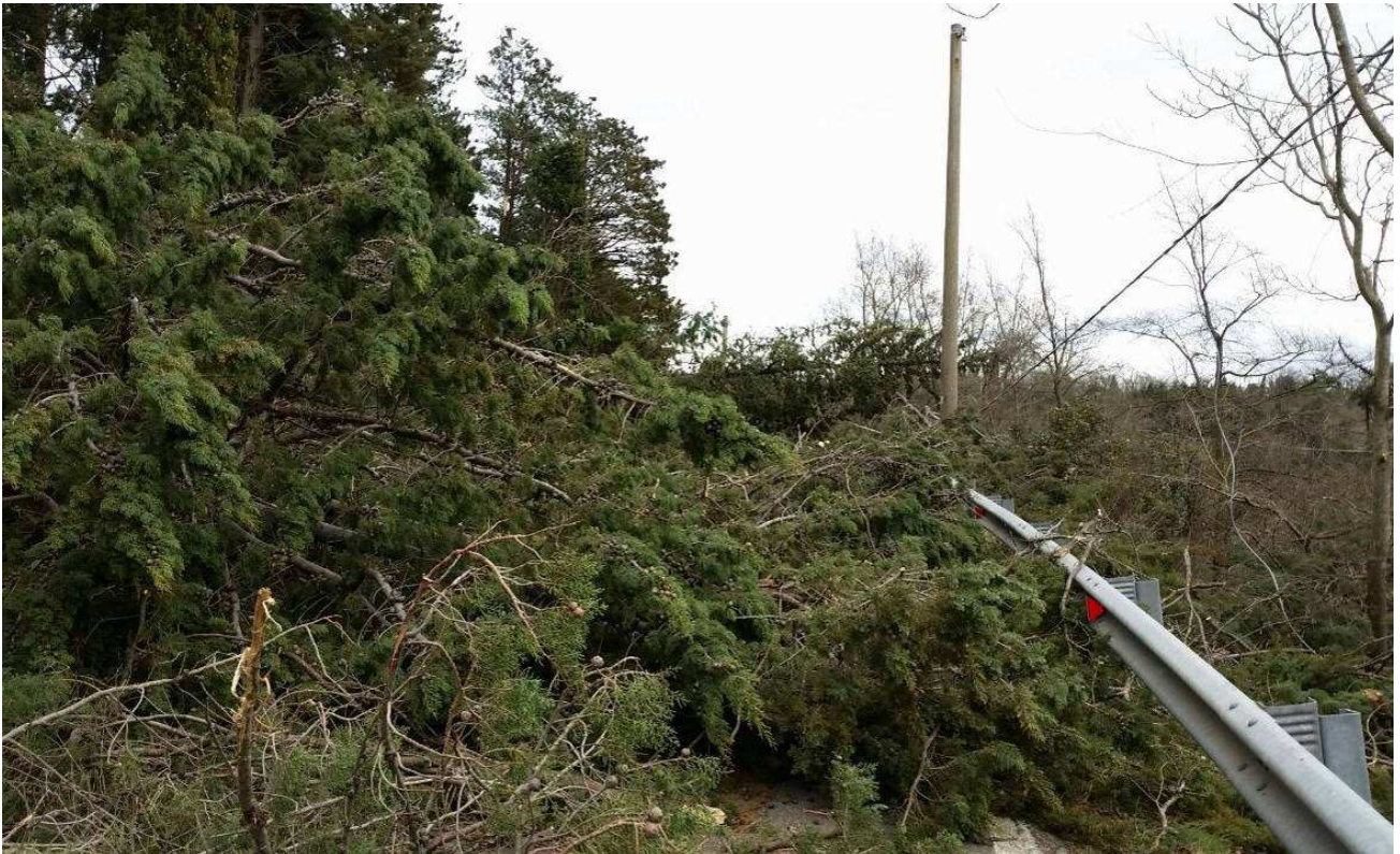
SP130 di Monte Morello (Sesto Fiorentino)