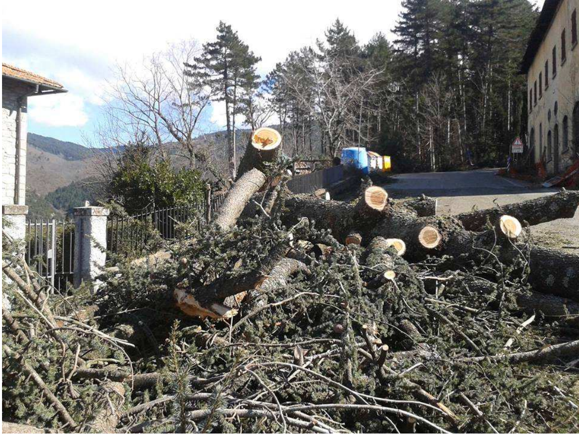
SP85 di Vallombrosa (Reggello)