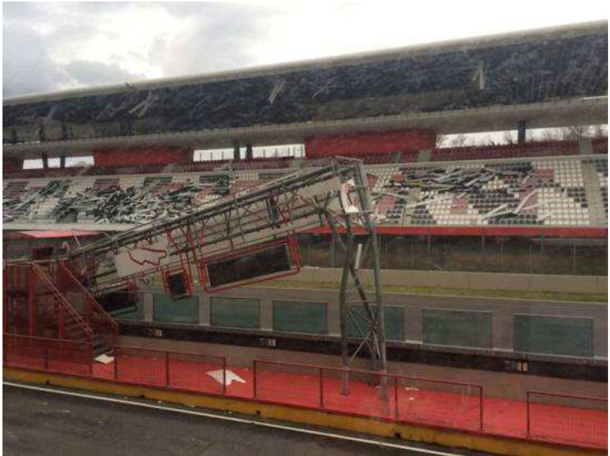
Autodromo Mugello (Scarperia e San Piero)