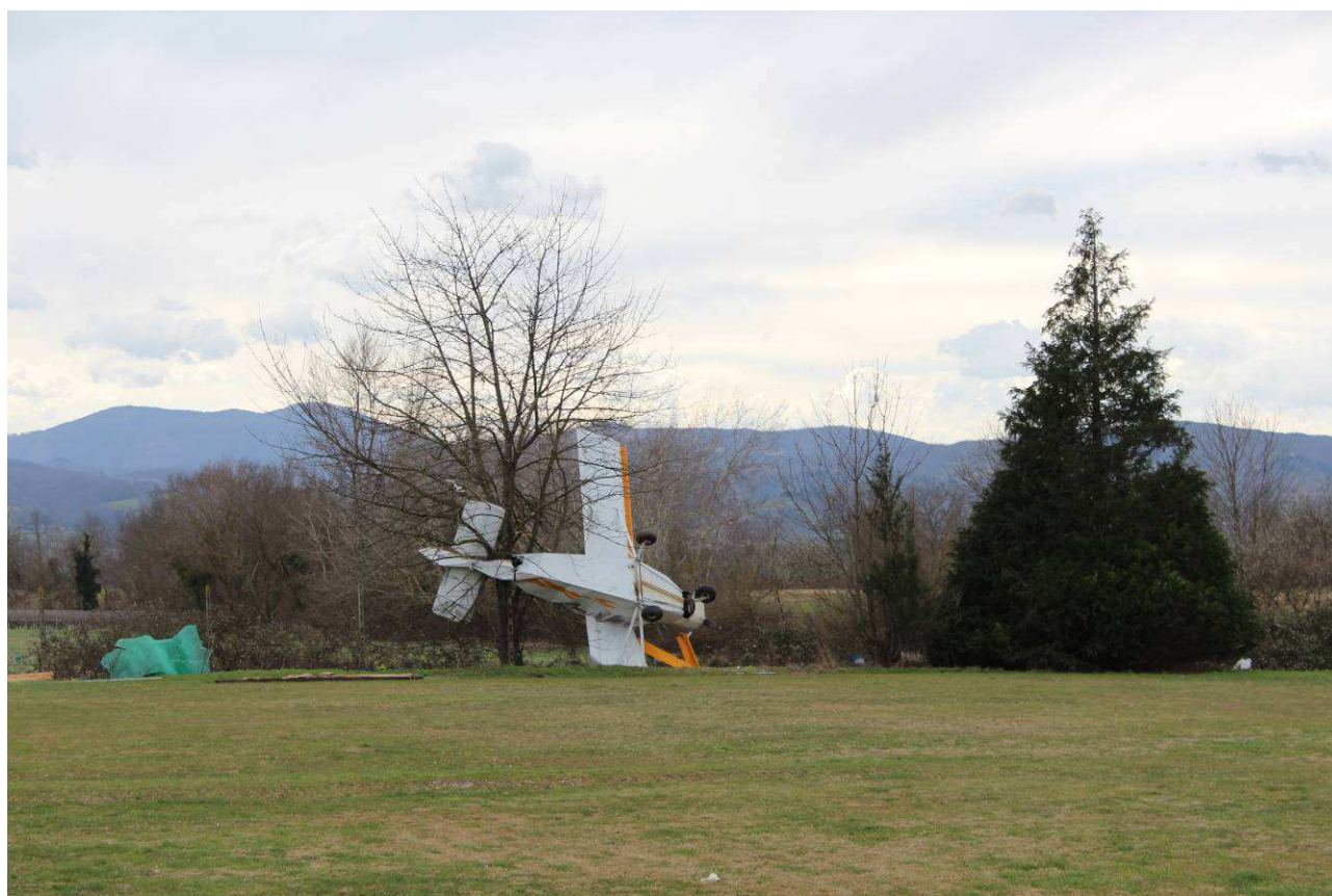
Danni aviosuperficie Figliano (Borgo San Lorenzo)