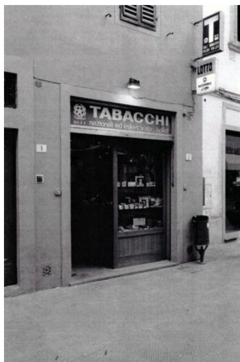
La tabaccheria oggi