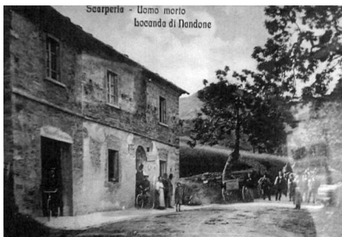
La locanda nel 1918