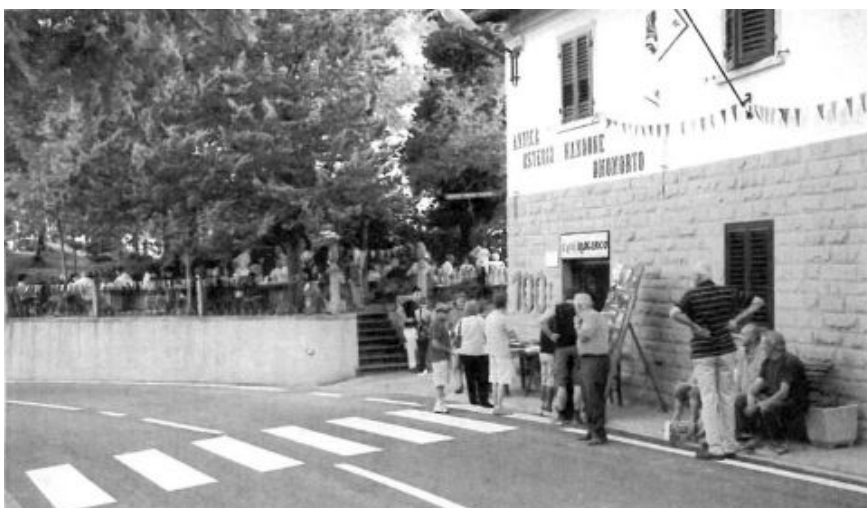
L'Osteria nel giorno dei festeggiamenti per il 100mo anniversario (2008)

Ufficio Stampa - Tel. 055/2392172 - stampa@fi.camcom.it