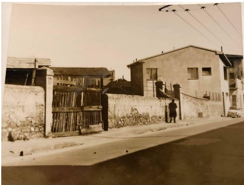
Esterno della sede, anni '50

La Ferramenta Cobianchi Spa opera su una superficie di 8.000 mq; di questi, 2000mq costituiscono il piazzale adibito al transito di automezzi ed al parcheggio clienti. L'azienda effettua la distribuzione di oltre 18.000 articoli ferramenta, edilizia e garden in Toscana, Umbria ed alto Lazio. Nella mission aziendale è fondamentale il servizio al cliente correlativamente alla distribuzione di marchi riconosciuti e di qualità. La sede legale è nel comune di Firenze.