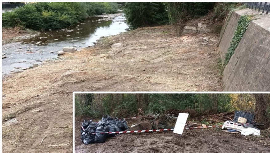
Loc. Gamberame - Vaiano